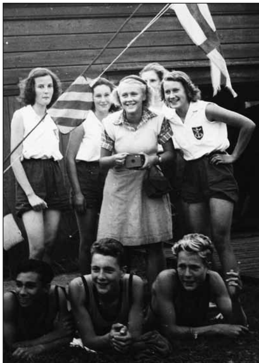
Het jeugdteam dat deelnam aan het Nederlands Kampioenschap in 1941.

Op 18 juli 1950 bestaat Het Spaarne precies 65 jaar. Op deze dag ontvangt de vereniging het predicaat Koninklijk, mede vanwege de uitzonderlijke verdiensten tijdens de Tweede Wereldoorlog. Vanaf dat moment wordt het kroontje toegevoegd aan het verenigingswapen. Ook het 75-jarige jubileum in 1960 wordt groots gevierd. In datzelfde jaar wordt op last van de brandweer wel de karakteristieke toren van het gebouw verwijderd. In 1985 volgt het 100-jarig bestaan, met als eregast H.K.H. Prinses Margriet. Ter gelegenheid van het feest verschijnt een gedenkboek waarin het verleden uitvoerig wordt beschreven en in beeld gebracht.