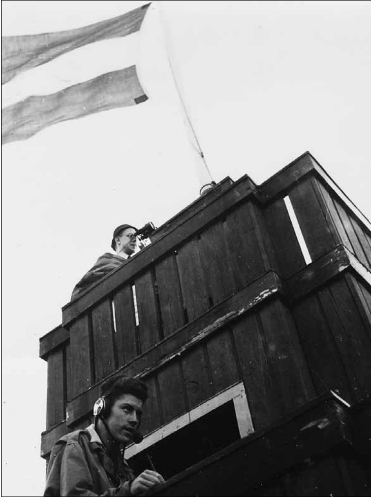
Bij het Nederlands Kampioenschap voor de jeugd in 1941 wordt er verslag gedaan vanaf de toren die toen nog op het verenigingsgebouw stond.

Maar het is nog steeds oorlog en de situatie wordt grimmiger. Een aantal leden neemt samen met bootsman Bakker actief deel aan het verzet. Onder de vloer van de loods worden door de RAF gedropte wapens verborgen. Skiffeur Cox vervoert de wapens naar adressen elders. Een aantal leden van Het Spaarne wordt door de Duitsers gearresteerd en wegens verzetsactiviteiten geëxecuteerd. Een bronzen plaquette in de clubzaal herinnert ons nu nog aan hun moedige verzet.