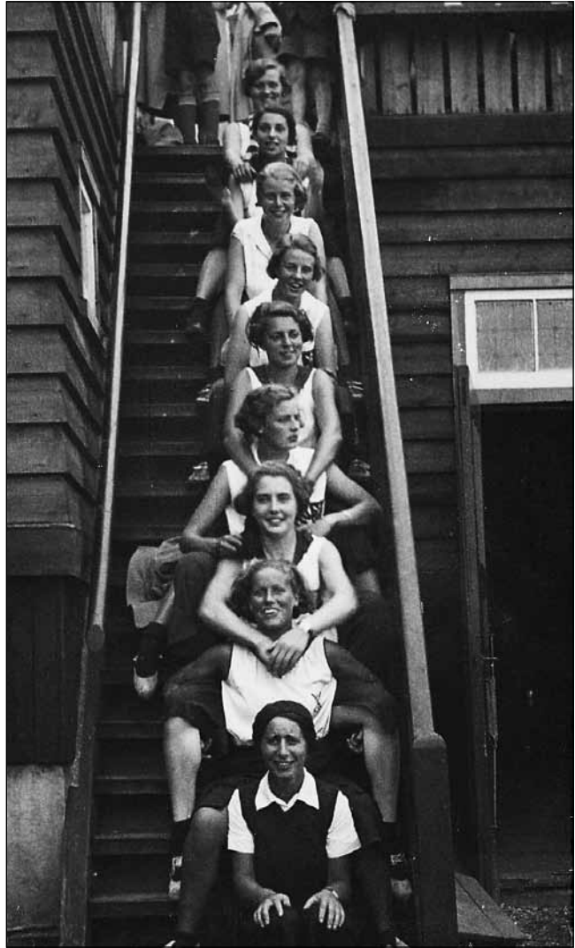
De dames 8 in 1934 op de trap van het verenigingsgebouw.