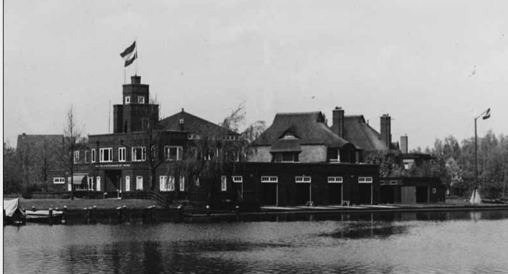
Het gebouw van de Roei- en Zeilvereniging aan het Marisplein in 1932.